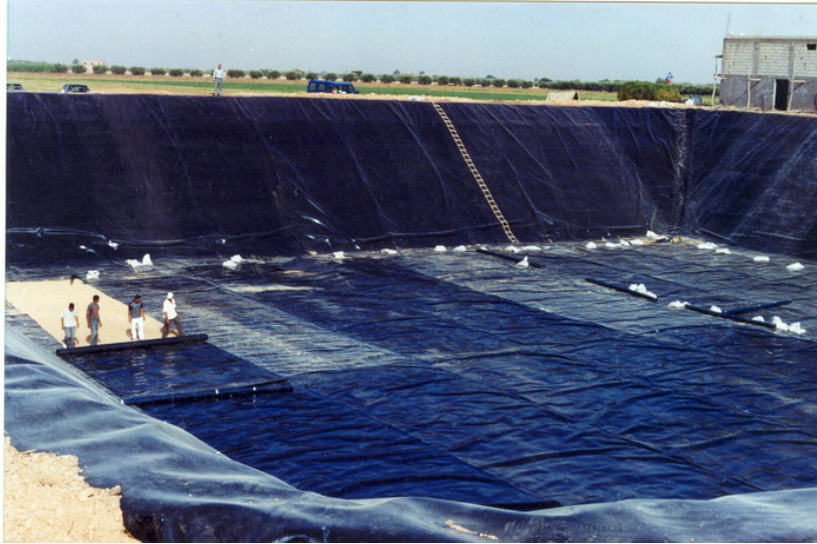
FIG. 5 – Mise en place des géomembranes dans un bassin de stockage

durer 3 à 4 semaines voire plus (tableau 3), alors que les installations d'irrigation au goutte-à-goutte sont conçues pour alimenter le sol chaque jour et apporter la quantité correspondant à l'évapotranspiration.