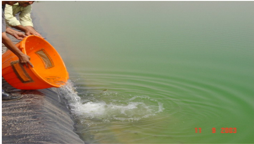
FIG. 3 – Introduction de la carpe chinoise dans un bassin d'irrigation

Une fois ce temps de contre-lavage écoulé, le programmeur, via le solénoïde, libère la pression du piston ; les disques se resserrent et la vanne 3 voies reprend sa position " filtration ". Le 1 er filtre est lavé, et retrouve sa position initiale.