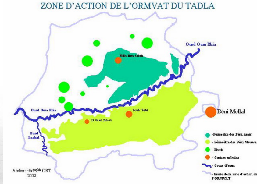
FIG. 1 – Périmètre irrigué du Tadla.